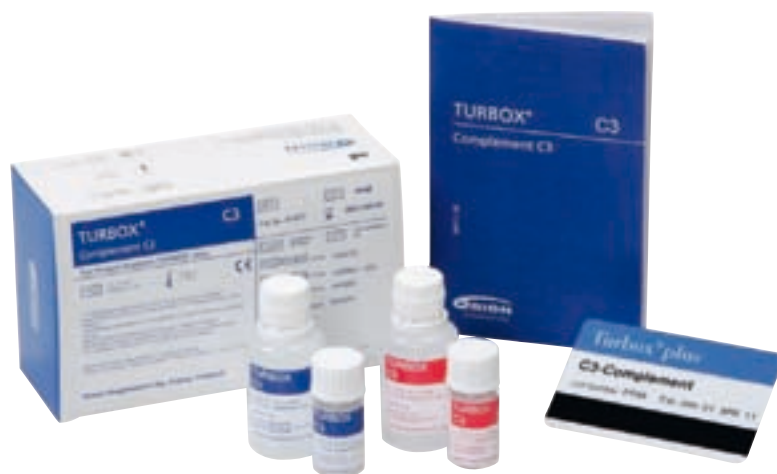
Рис. 3. Набор к системе Turbox plus.