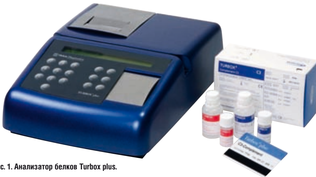
Рис. 1. Анализатор белков Turbox plus.