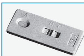
Рис. 1. Тестовая кассета на ПСА, общий вид, размеры 65 мм x 27 мм x 5 мм

Количественная ИХЭД. Чтобы оценить тяжесть патологии важен количественный результат – концентрация тестируемого вещества. Именно для этого и разработаны специальные «количественные» тестовые кассеты и ридеры для них. Эти компактные, но точные приборы действительно можно положить в саквояж, и разместить везде, где есть электричество, в медицинском кабинете любого учреждения, особенного детского, школьного или университетского. Недаром ридер, изображенный на рис. 3, называется «Easy». Но он легкий не только по весу, но и в обращении. Один из мировых лидеров в разработке ИХЭД – французская компания VEDA.LAB. Разработанные этой фирмой «количественные» тестовые кассеты и ридеры дают и считывают постепенное увеличение интенсивности окраски. В диапазоне от нулевой до максимальной, пропорциональной концентрации антигена. И «прищуривать глаз» на эти кассеты не следует – у них нет фиксированного пограничного (cut off) уровня, характеризующего концентрацию, выше которой начинается патология. Но ридер эти кассеты просканирует и на каждую выдаст чек, который можно пришить к делу, впрочем, ридер его тоже «запомнит».